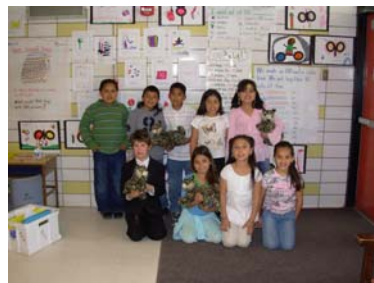
Los Alamos del tercer grado se sonrien con los gatos salvajes

Felicidades a nuestros estudiantes y a sus familias que fomentan valores positivos.