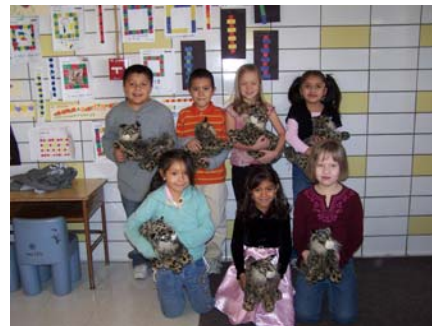
Embajadores de la paz de segundo grado sonríen en grande con sus gatos salvajes

Felicitaciones a nuestros embajadores de la paz y sus familias.