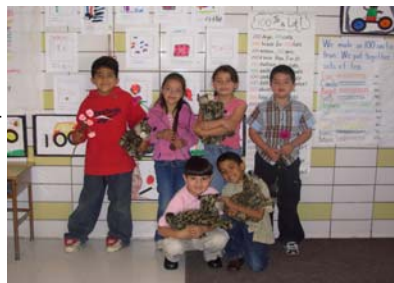
Los estudiantes de segundo grado se ríen con sus gatos monteses!

Felicidades a nuestros estudiantes y a sus familias que se comprometen a aprender en Columbine.