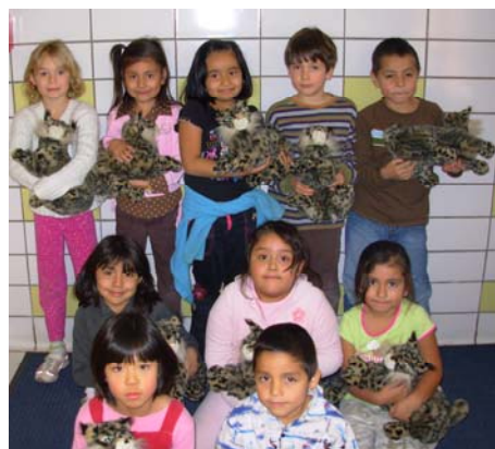
recibidores de primer grado